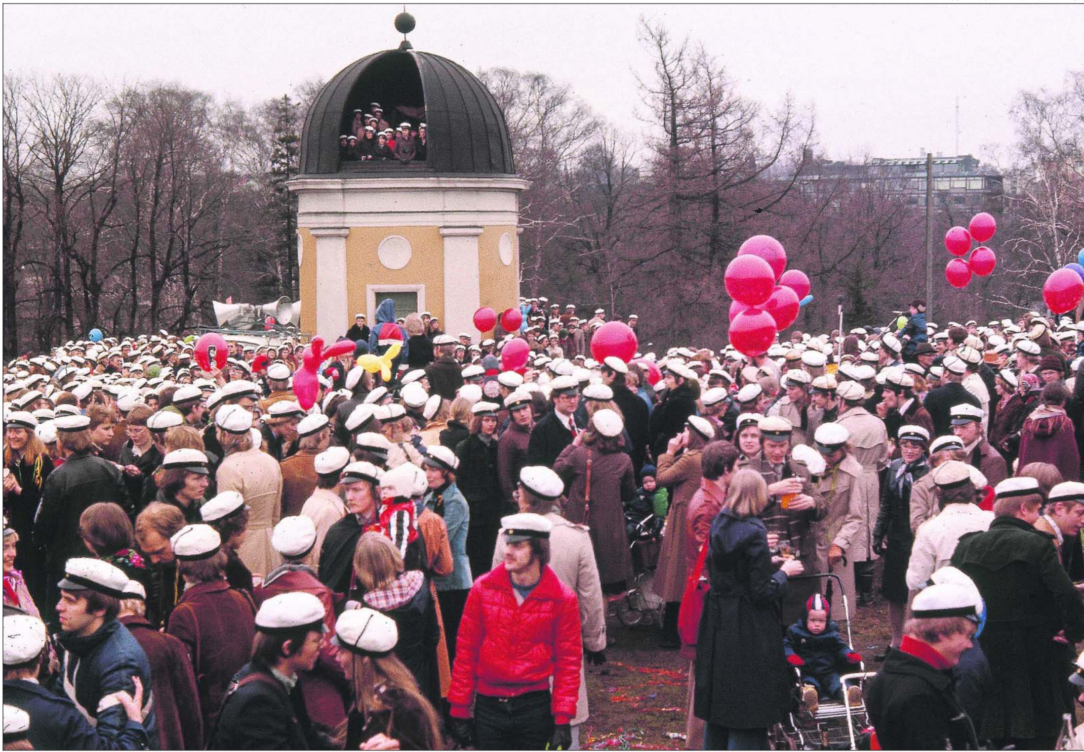
Ylioppilaat kokoontuivat Helsingin Kaivopuistoon juhlimaan vappua vuonna 1975.