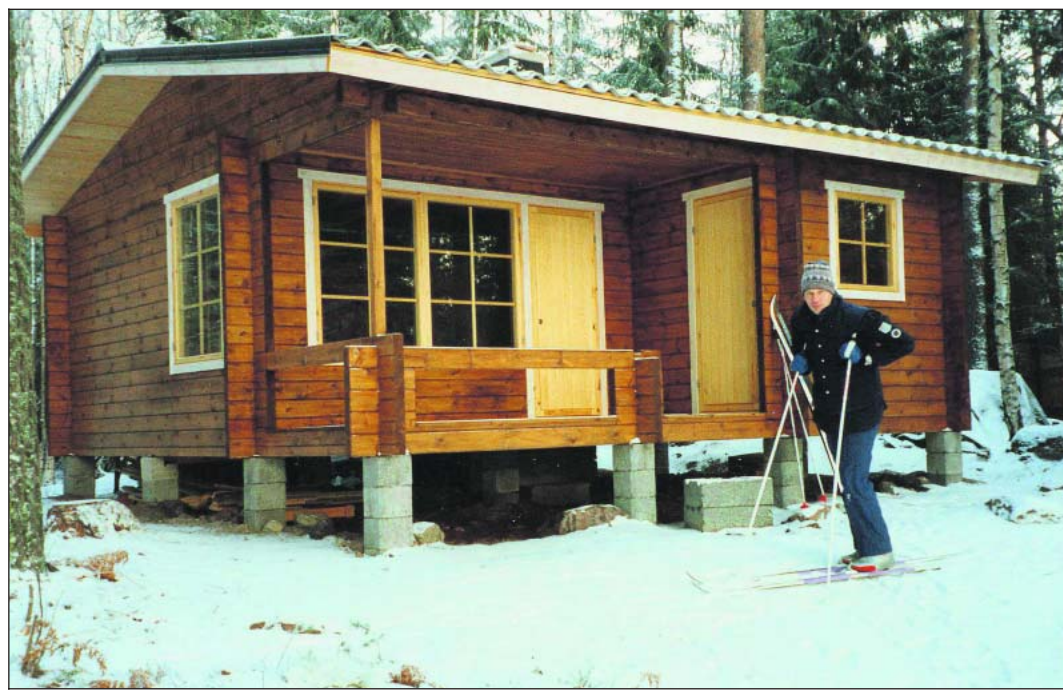
Mänttären mökki saatiin valmiiksi työttömyystalvena, kun perheellä oli enemmän aikaa.